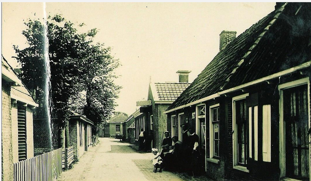
Folsgeare begjin 1900, rjochts it tsjerkehûs ( mei de blinen )