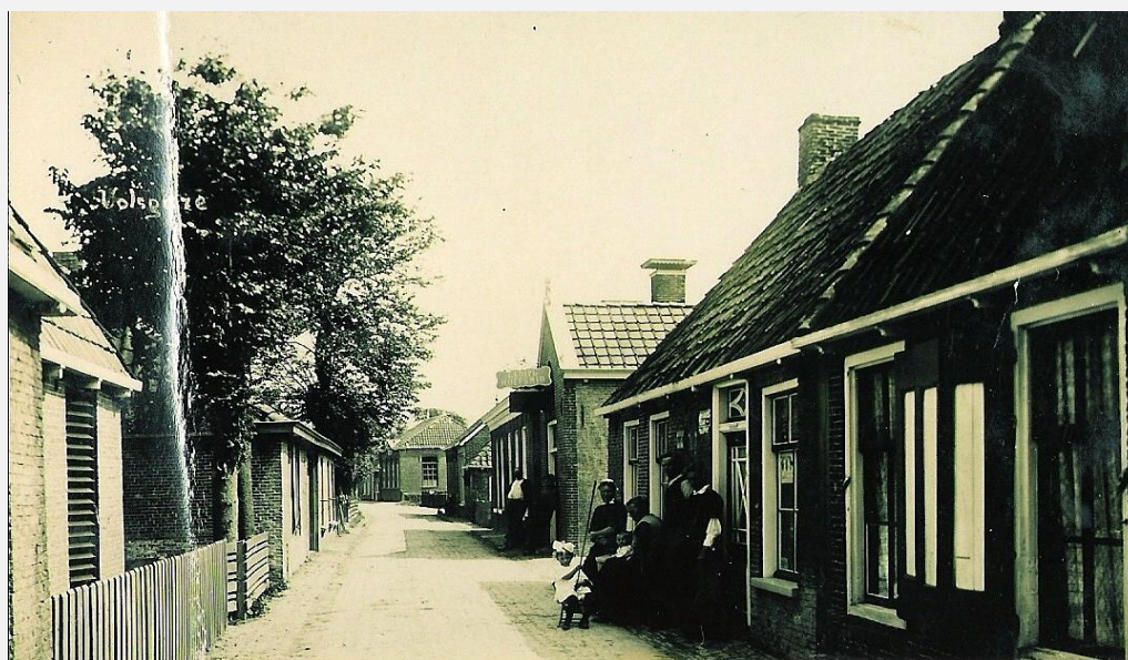
Folsgeare begin 1900, rechts het kerkhuis (met de blinden)