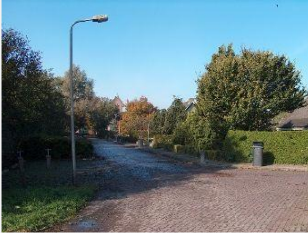
Folsgeasterleane richting dorp.