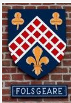
Het wapen van Folsgeare