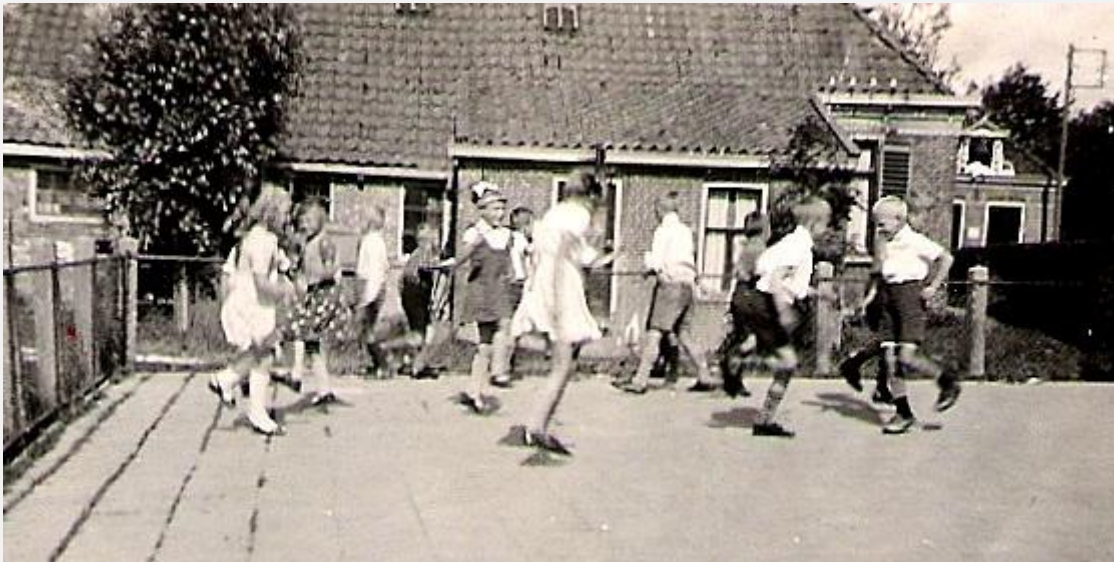
Schoolplein in de dertiger jaren van de vorige eeuw.