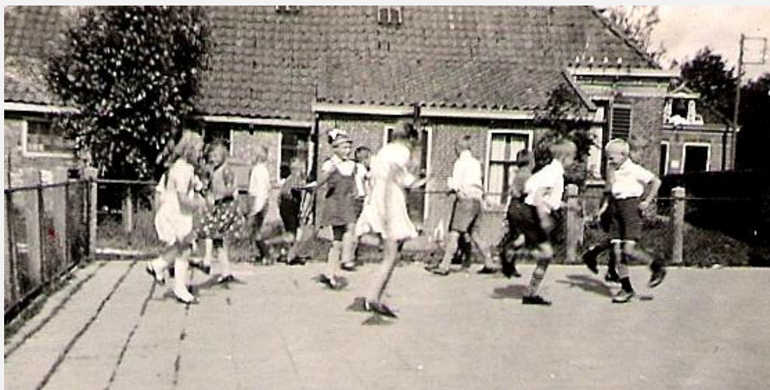
Skoalplein yn 'e tritiger jierren fan 'e foarige iuw.