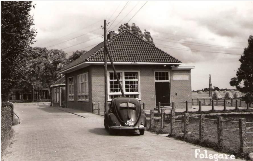
Skoalle nei 1938