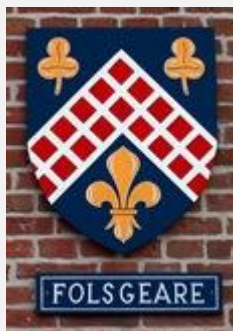
It wapen fan Folsgeare