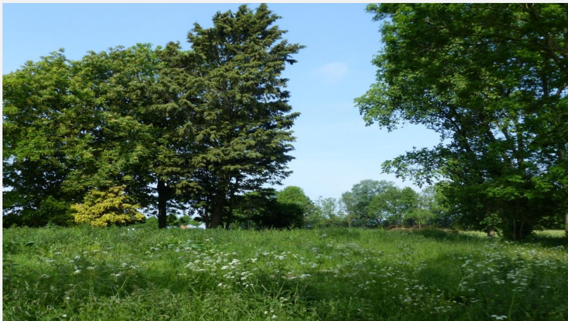
Foto Wytke Heida, it plak dêr't de pleats stie wêr't Willem Abma wenne hat

Soms hat fiksje in foarsizzende wearde”, om’t it gedicht skreaun is yn in tiid dat de rûnwei om Snits der noch net lei en de pleats noch net sloopt wie.